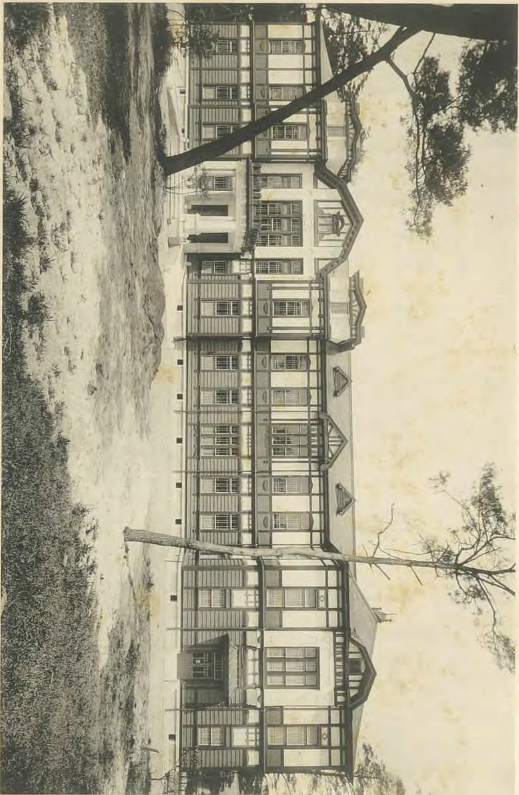
九洲帝國大學皮膚科新教室前面